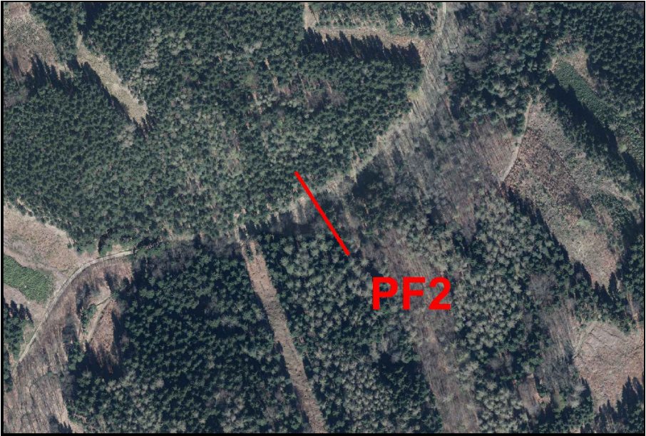
B.3.SO 24.5 Příčný profil navrhovaným opatřením SO 24b