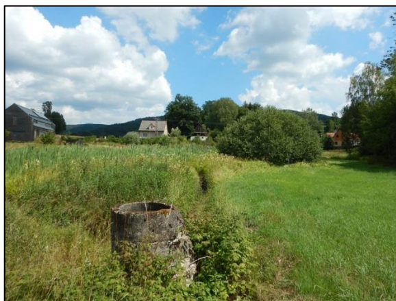
obr. 6 – pohled na tuto šachtici proti vodě, uprostřed odvodňovací strouha ze zamokřeného území