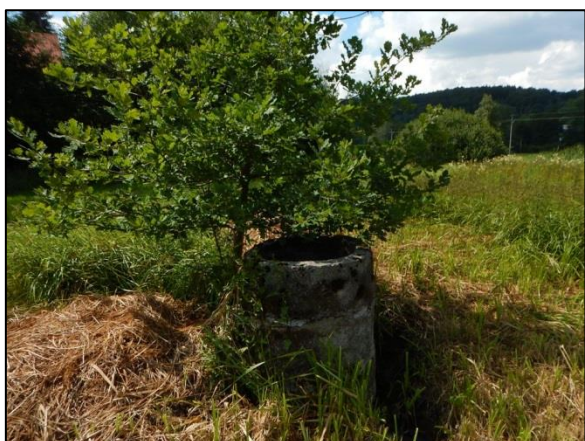
obr. 3 – šachtice na zatrubněném toku