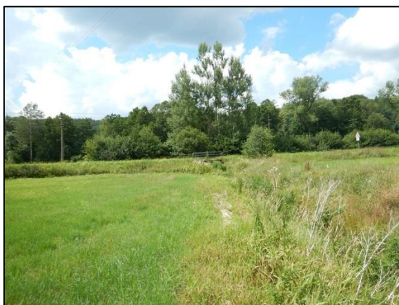
obr. 8 – otevřená opevněná část koryta směrem k silnici