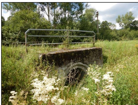
obr. 9 – konec úseku, propustek pod silnicí