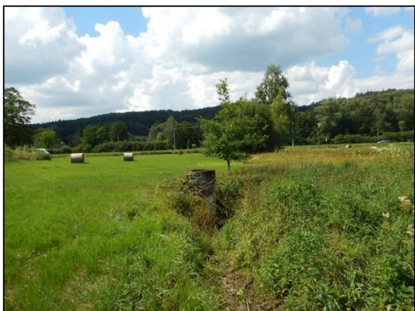
obr. 5 – další šachtice s obnaženými skružemi