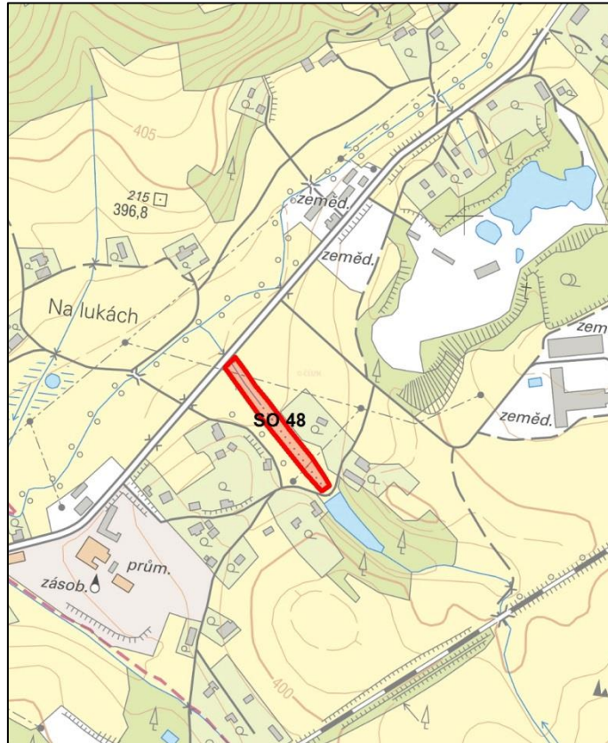
obr. 2 - Přehledná situace opatření

Revitalizací toku se rozumí uvedení v minulosti technicky upraveného toku do přírodě blízkého stavu, tedy zejména vytvoření přirozené morfologie koryta, obnovení přirozeného splaveninového a hydrologického režimu. V případě revitalizací mluvíme jednak o investičních revitalizacích, to znamená, že ke změně dojde vlivem realizace stavby a dále o samovolné renaturaci koryta toku (zpřirodnění), ke které dochází postupně (dlouhodobě), víceméně samovolně vlivem přirozených procesů. Pro tento postup je nutné dodržovat zásady ekologicky šetrné správy vodního toku, která přirozený vývoj koryta umožní v rámci vymezeného pásu. Zásahy jsou prováděny pouze v nejnutnějším rozsahu s ohledem na požadavky využití okolního území např. z důvodu ochrany zástavby, ochrany infrastruktury, vzniku hloubkové eroze a nadměrné boční erozi mimo vymezený koridor.