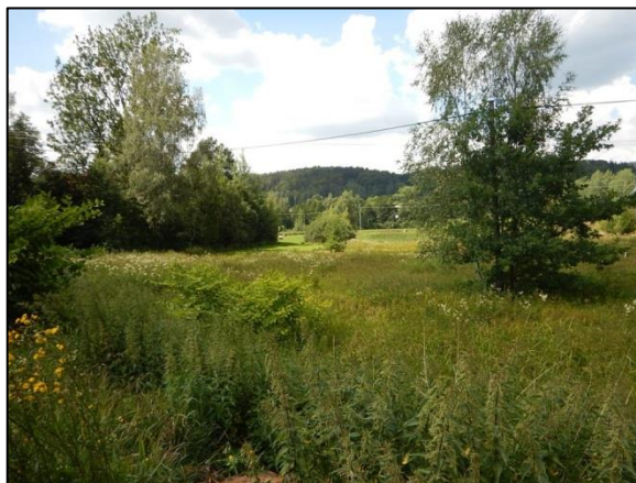
obr.2 – pohled ze silnice na zamokřenou plochu se zatrubněným úsekem