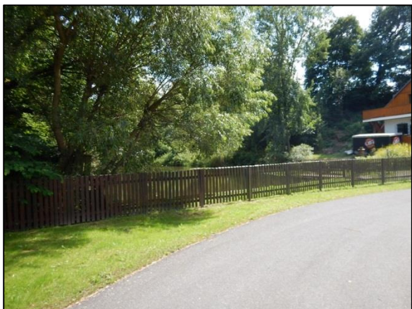
obr. 1 – rybníček nad revitalizovaným úsekem

V rámci opatření je navrhována revitalizace úseku Malé Jeřice mezi železničním viaduktem a hlavní silnicí přes Oldřichov v Hájích. Revitalizace navazuje na revitalizace Malé Jeřice nad viaduktem. Je uvažována rovněž revitalizace levého přítoku Malé Jeřice, který je rovněž napřímen a opevněn. Na soutoku obou toků je vhodný prostor pro vytvoření tůň.