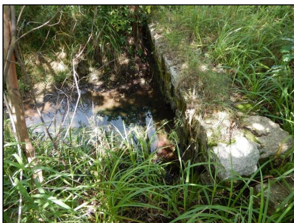
obr. 7 – výtok ze zatrubněné části