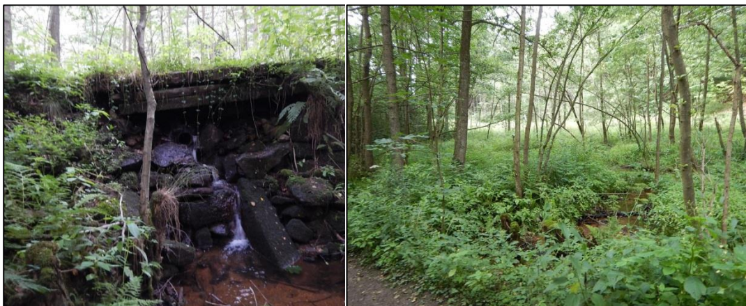
obr. 1 – uvažovaná hráz vodní nádrže tvoří zároveň lesní cerstu (současný stav je spíše provizorní)

V rámci opatření je navrhována revitalizace úseku Malé Jeřice mezi železničním viaduktem a hlavní silnicí přes Oldřichov v Hájích. Revitalizace navazuje na revitalizace Malé Jeřice nad viaduktem. Je uvažována rovněž revitalizace levého přítoku Malé Jeřice, který je rovněž napřímen a opevněn. Na soutoku obou toků je vhodný prostor pro vytvoření tůň.