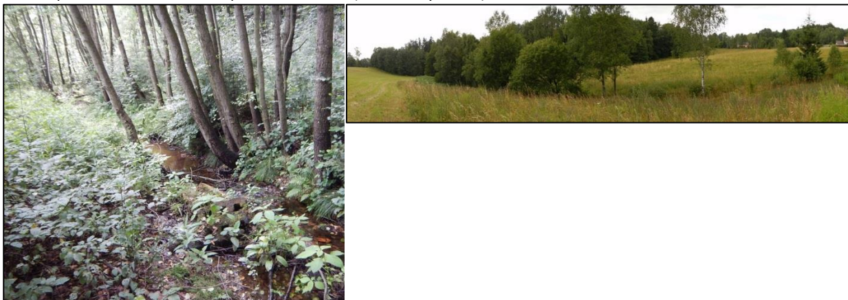
obr. 3 – zbytky opevnění v korytě toku navrženého pro revitalizaci