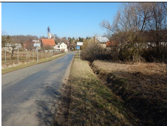
obr. 1 – Pohled na profil KB (JZ okraj obce Vitice)

Stávající kritický bod se nachází na Vitickém potoce na jihozápadním okraji obce Vitice. Plocha povodí je tvořena převážně zemědělskými pozemky, zahrnuje také intravilán vesnice Močedník. Ohroženým místem je zemědělský areál a obytná zástavba na okraji obce podél komunikace č.III/10811 vedoucí do Chotýše. K ohrožení v tomto KB přispívá také série propustků, v místech kde je koryto vedeno podél zmiňované komunikace. Povodí tohoto KB je ve své horní části tvořeno povodím KB 10408043.