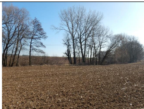
obr. 2 – Pohled na Vitický potok v zemědělské krajině nad Viticemi