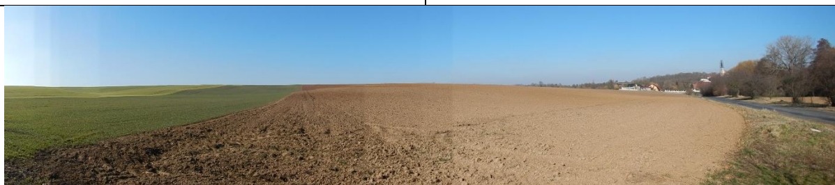
obr. 3 – Celkový pohled na pole nad zástavbou obce Vitice