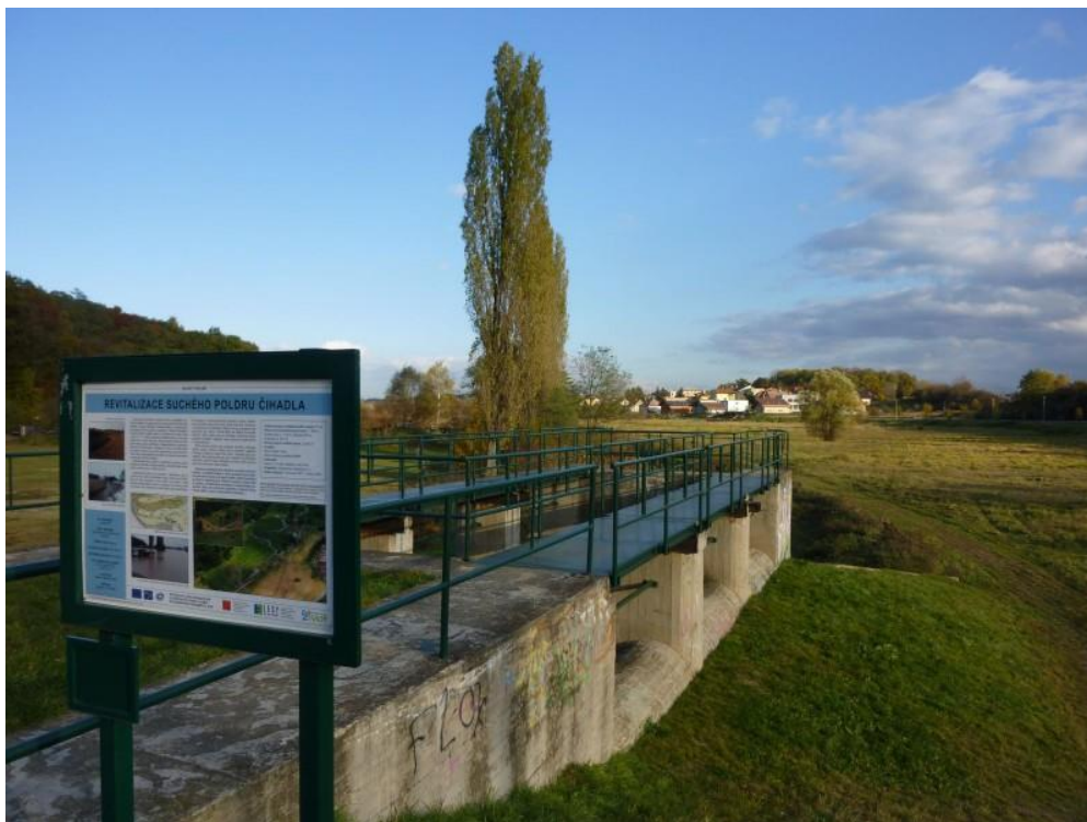
Obrázek 3: Ilustrační obrázek sdruženého objektu – Poldr Čihadla