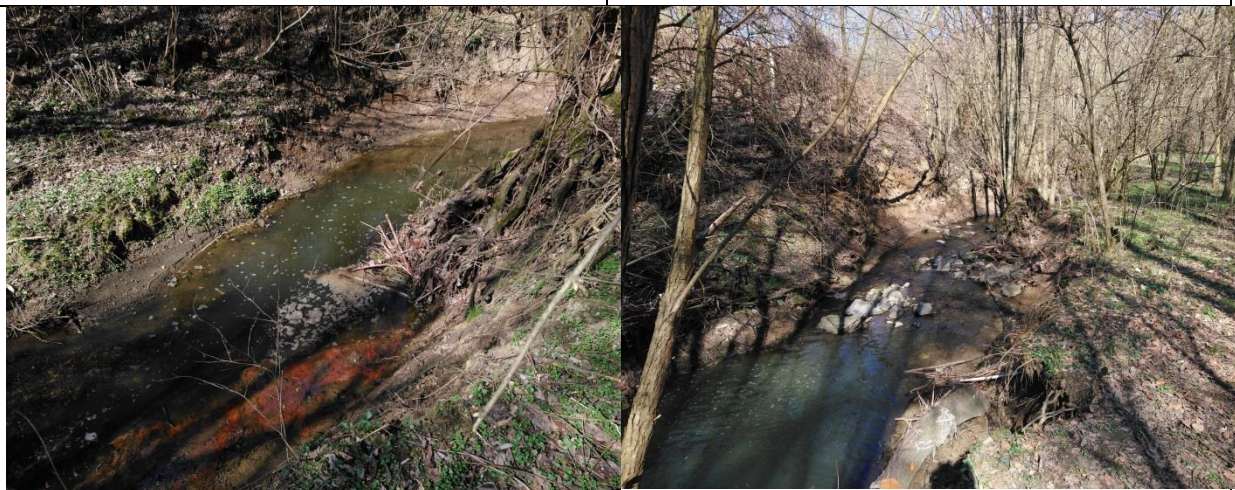
Obrázek 6 a 7: Koryto Říčanského potoka je v tomto úseku nestabilní a zahlubuje se