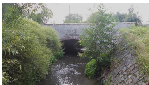
Obrázek 2: Křížení komunikace 33312 a Říčanského potoka

Hlavní funkcí stavby bude ochrana území pod suchou nádrží před povodněmi. Realizací díla dojde ke zlepšení časového průběhu povodňové vlny a snížení její kulminace. Účelem stavby je při povodňových stavech transformovat průtoky v Říčanském potoce zdržením vody v retenčním prostoru s pozvolným vypouštěním pod hráz nádrže.