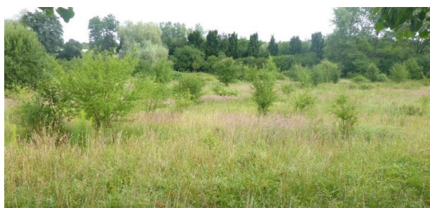
Obrázek 1: Zájmové území zátopy SN (07/2017)

Pro návrh opatření byly využity podklady Stavba č. 42124 „PPO 2013 – Modernizace a rozšíření části PPO“, poldr Kolovraty, VRV a.s., 2018.