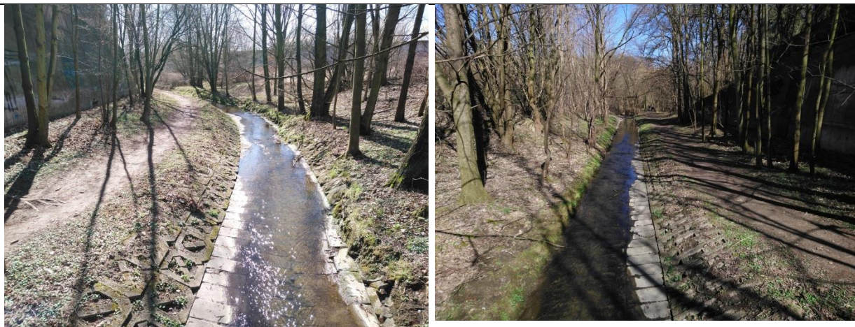
Obrázek 4 a 5: Nevhodné opevnění koryta Říčanského p. na začátku úseku plánované revitalizace

Říčanský potok je v tomto úseku napřímen a částečně opevněn (viz. obr 4 a 5). V místech kde opevnění chybí je pozorována hloubková eroze. V rámci revitalizace dojde k odstranění opevnění a ke zmeandrování toku dle jeho morfologického typu. Dojde tak ke snížení podélného sklonu a rychlosti vody v korytě. První polovina revitalizace má omezené prostorové možnosti, zde dojde k rozvolnění koryta, meandrující pás bude veden ve stávající trase. V dolní polovině, v úseku okolo ČOV je v pravém břehu prostor pro rozšíření nivy. Zde bude vytvořena nová trasa toku s plně vyvinutým meandrováním. Vhodné je také doplnit koryto po celé délce revitalizace o prvky mrtvého dřeva, kde bude docházet k lokálnímu vybití energie proudící vody. Krom stabilizace koryta, bude revitalizace přínosem také po stránce ekologické a estetické. Při jejím návrhu je počítáno s blízkostí cyklostezky, která je momentálně budována v úseku Mnichovice – Kolovraty a která se revitalizace dotýká na jejím začátku. Celkově tak vzroste rekreační potenciál celé lokality.