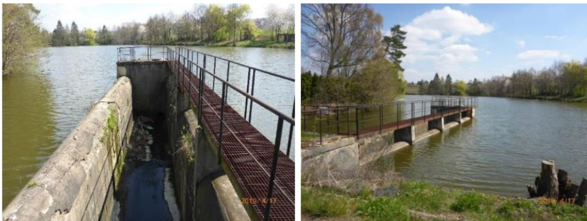
obr. 1 - Fotodokumentace sdruženého objektu n

Aktuální stav zajišťuje dostatečnou povodňovou ochranu před stoletou vodou, ale po stránce hydromorfologické členitosti pokulhává. Odstraněním opevnění povede k nastartování renaturačních procesů, které zlepší ekologickou i estetickou stránku vodního toku.