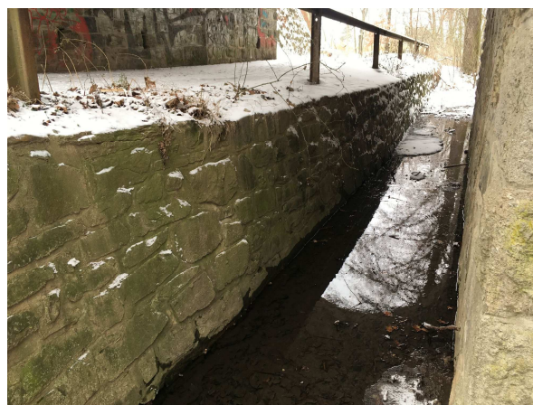
Koryto bezejmenného vodního toku vedené železničním podjezdem (IDVT 10245250), rozměr 1 x 1.5 m

V rámci řešení lokality jsou navržena 4 opatření pro zvýšení ochrany proti povodním a snížení erozní ohroženosti.