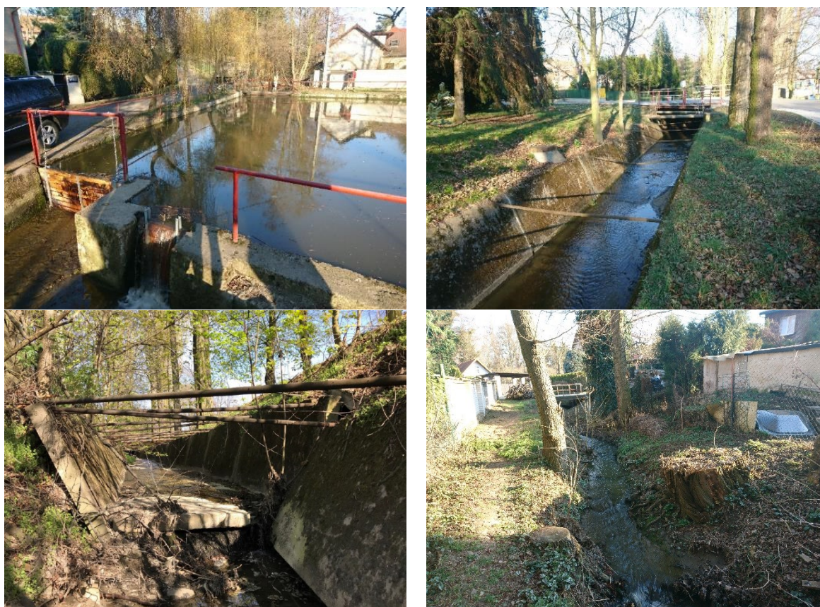
obr. 1 – Říčanský potok Světic