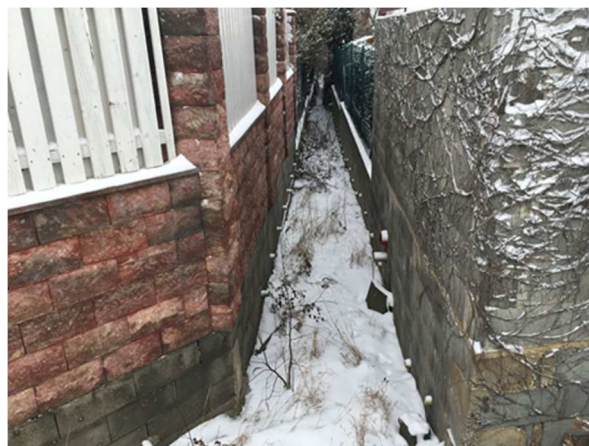
Svodný příkop za propustkem.

V rámci řešení lokality je navrženo 1 opatření pro zvýšení ochrany proti povodním a snížení erozní ohroženosti.