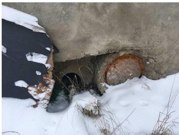
Nekapacitní propustek (vpust).

Návrhy v rámci povodí kritického bodu jsou prostorově limitovány územní rezervou pro komunikaci II. třídy č. 335 Lipany (SOK-) – Světice. Záměr vychází ze Zásad územního rozvoje pro Středočeský kraj. Označení záměru je WD 13.