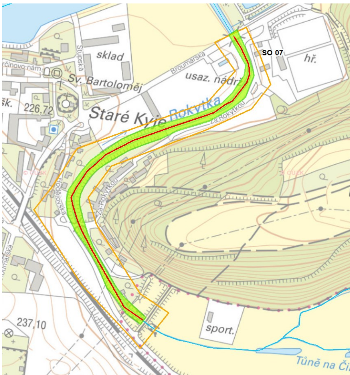
obr. 1 – trasování koryta