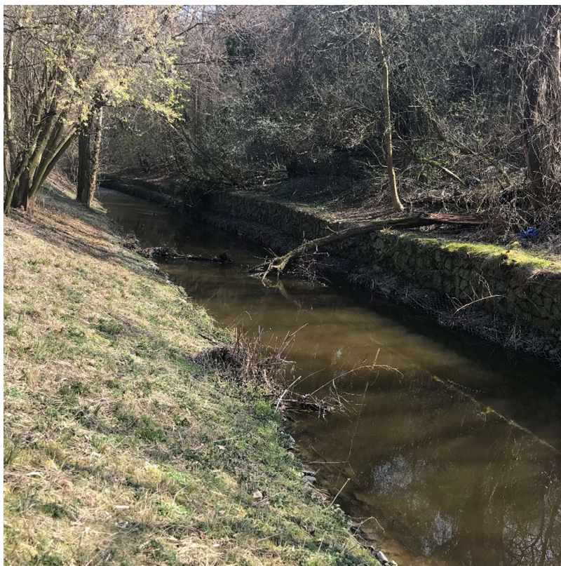
Obrázek 11 – Stávající gabionové zdivo podél levého břehu