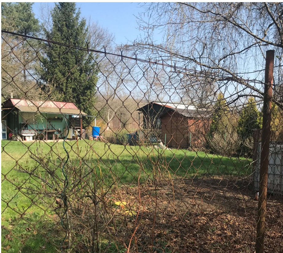
Obrázek 5 – Zahrádkářská kolonie podél pravého břehu