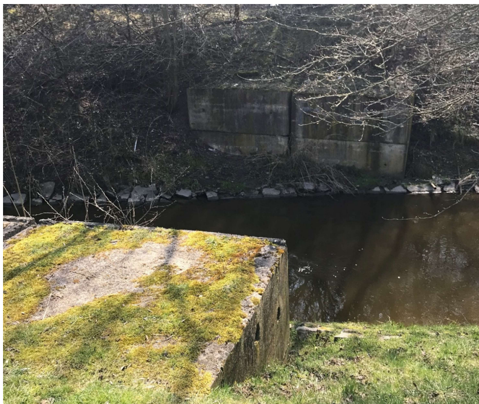
Obrázek 15 – Pozůstatky bývalého mostu přes vodní tok