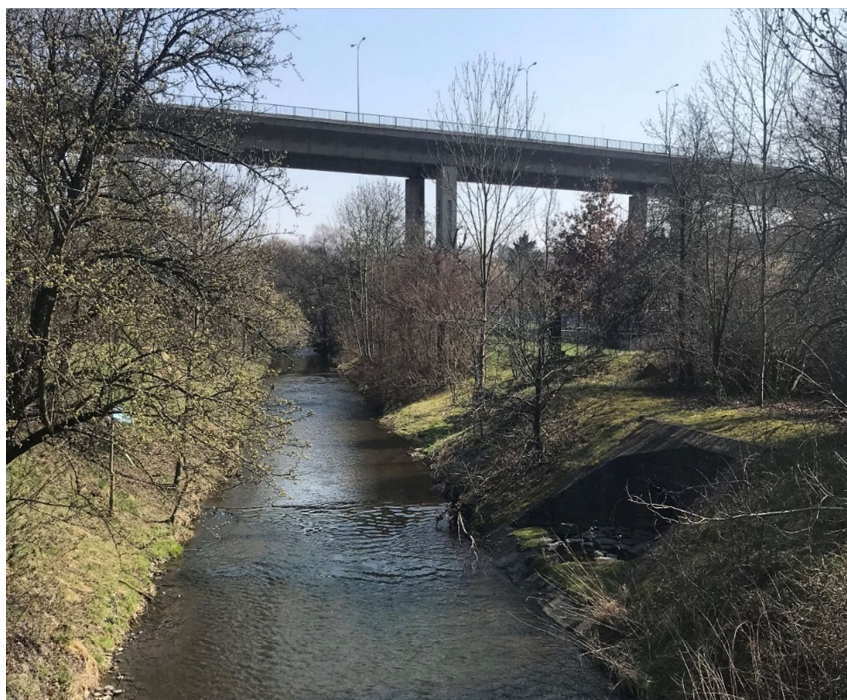
Obrázek 2 – Prizmatické koryto Rokytka na začátku řešeného území