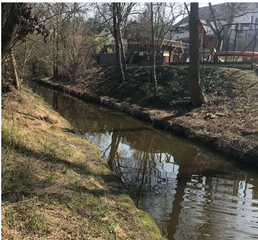
Obrázek 8 – Prizmatické lichoběžníkové koryto