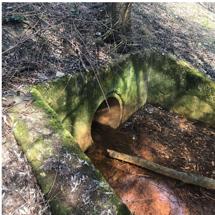
Obrázek 14 – Vyústění PVK, a.s. na pravém břehu toku