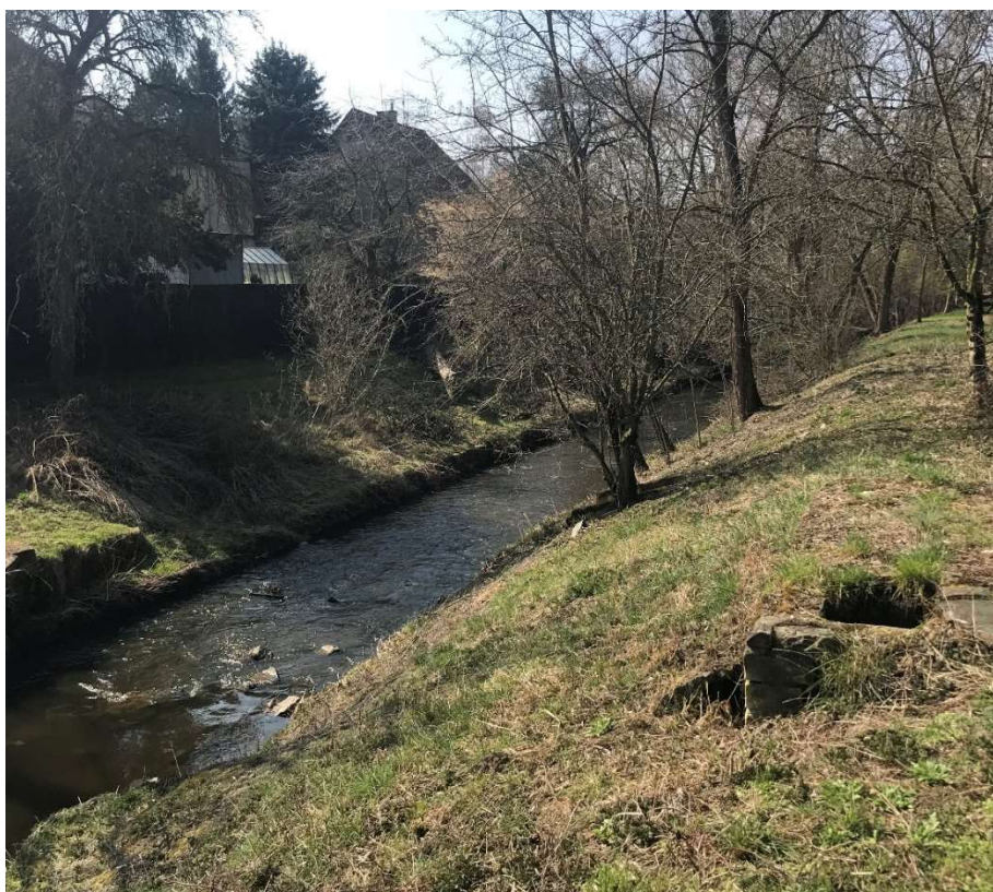
Obrázek 10 – Objekt PVK, a.s. na pravém břehu toku