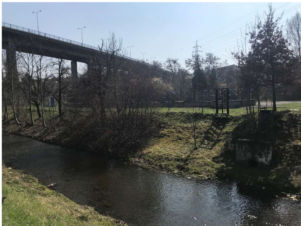
Obrázek 3 – Oplocený objekt PVK, a.s.