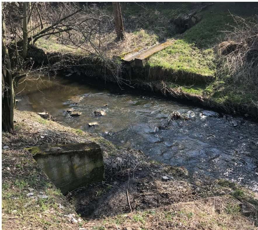
Obrázek 9 – Vyústění podél pravého i levého břehu toku