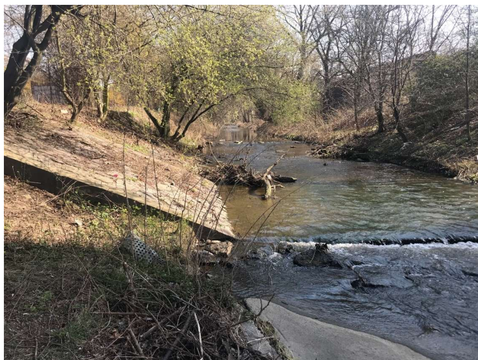
Obrázek 4 – Spádový betonový stupeň 1