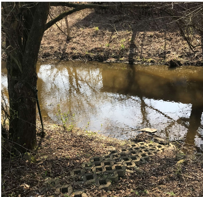
Obrázek 7 – Přístup k vodě vedoucí od zahrádek