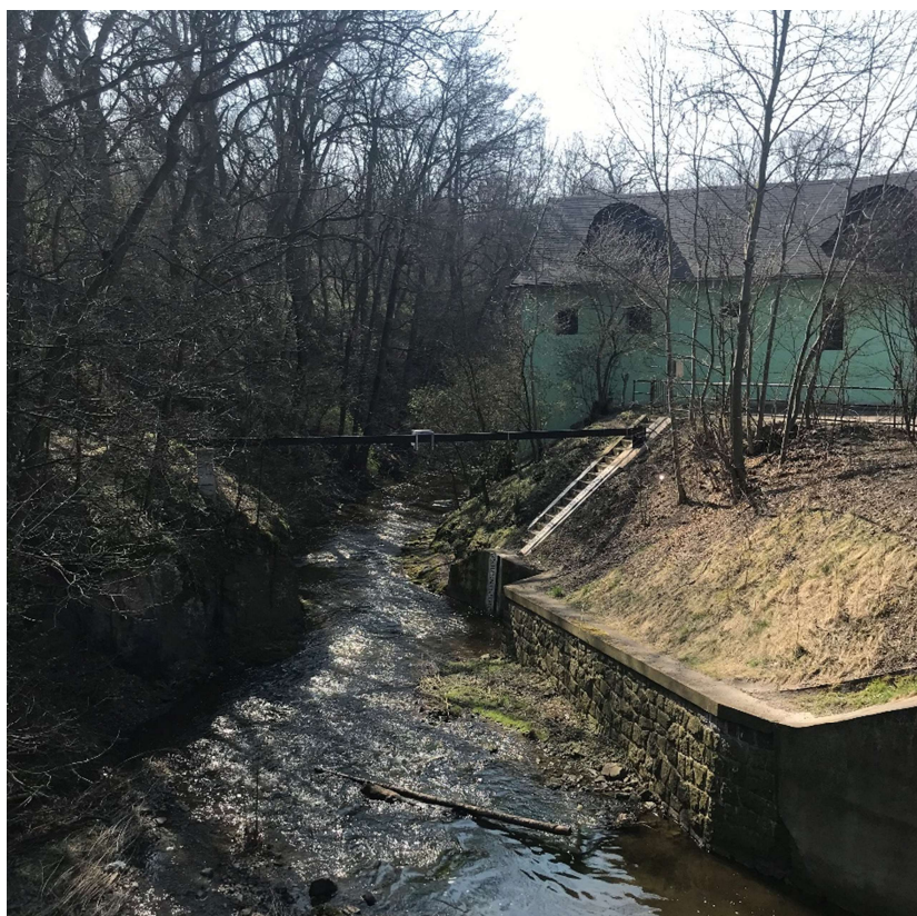
Obrázek 18 – Pohled na vodní tok Rokytky pod Kyjským rybníkem