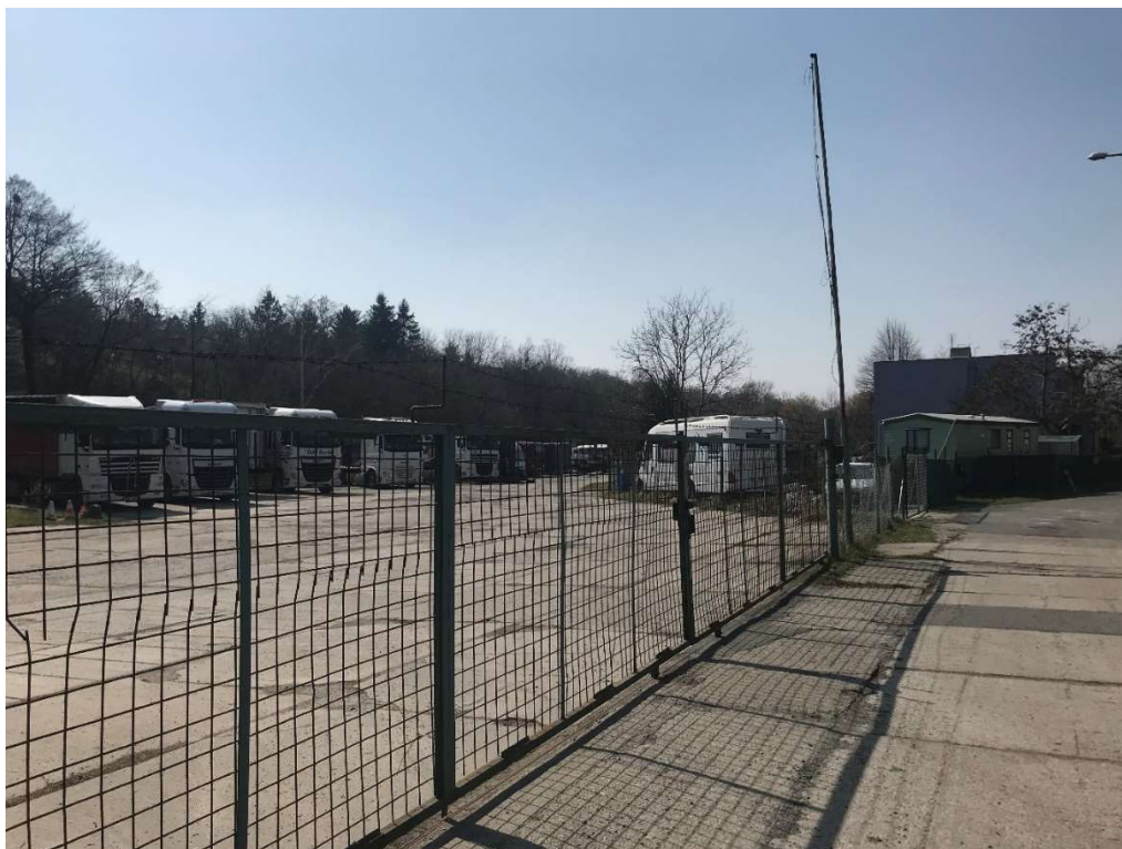
Obrázek 17 – Soukromý objekt podél pravého břehu toku