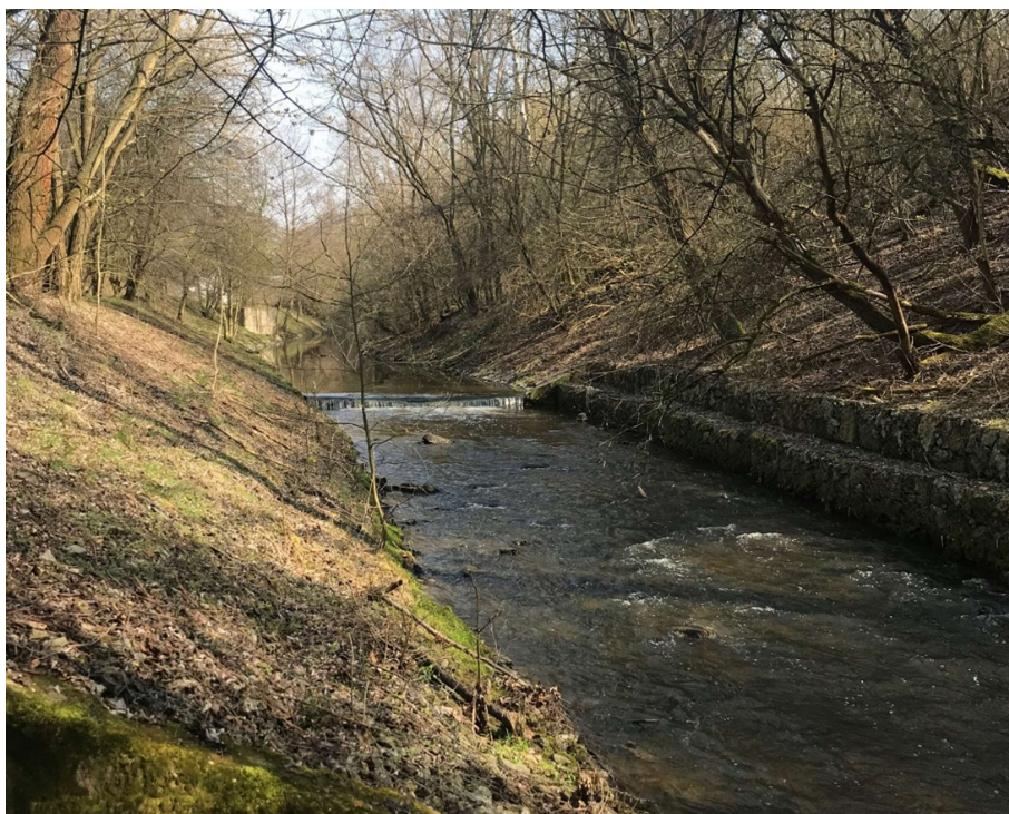
Obrázek 13 – Spádový betonový stupeň 2