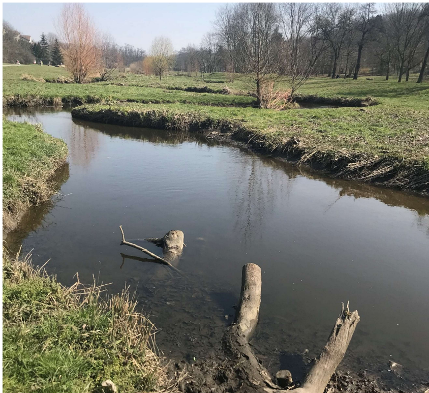
Obrázek 1 – Úspěšná revitalizace vodního toku Rokytka pod řešeným územím