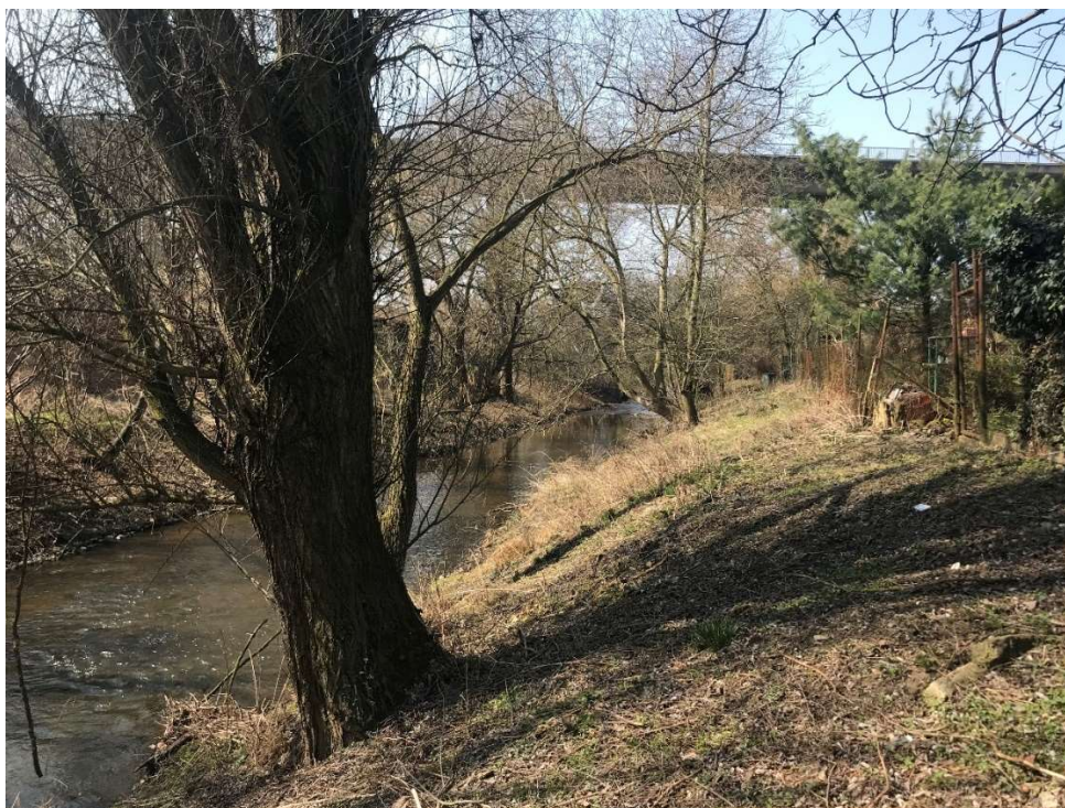
Obrázek 6 – Prizmatické koryto podél zahrádkářské kolonie