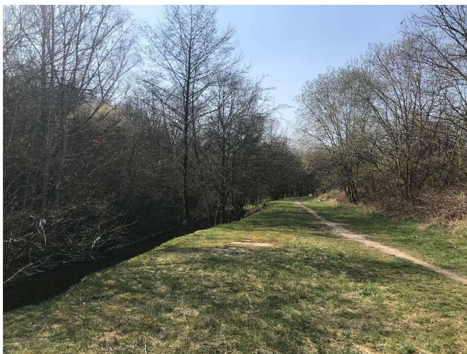
Obrázek 16 – Stezka vedoucí podél pravého břehu na konci řešeného území