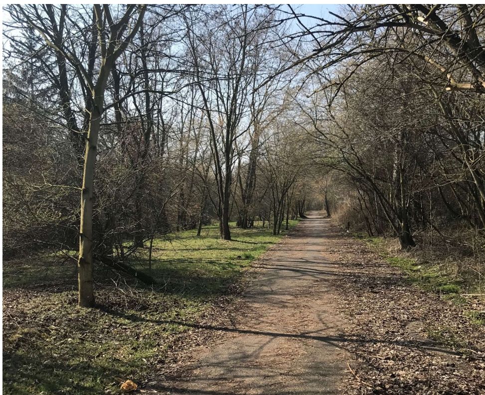
Obrázek 12 – Stezka vedoucí podél pravého břehu